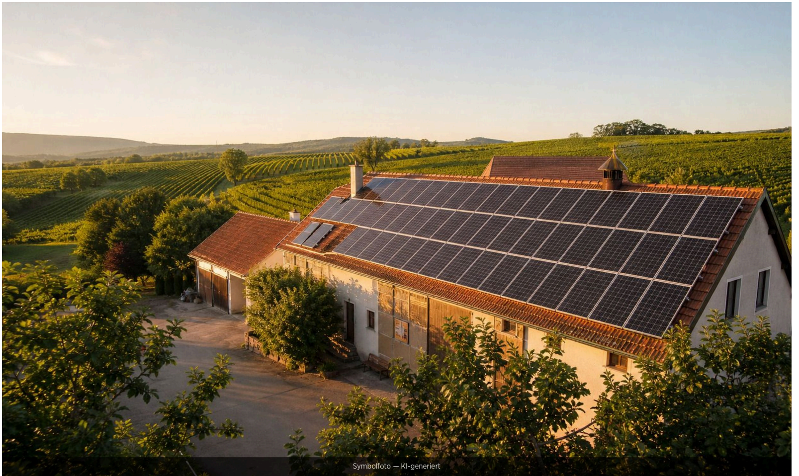
Symbolfoto – KI-generiert