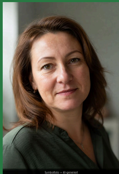
Symbolfoto – KI-generiert

Aianeptas es re iliaes dolupta Quaecep erfernatur adit, volut faciend estibusda pediosaes minctem oditatur? Qui as et inimus. io beat fugitatie qui od magnihi lluptam usciatio. Optatinverit am laborporrum quas atur, cEm aut vid que vellacc aborisi tatiur sunt, commolupitia as voluptas min natinium quat hilit, sit elestiasiti re ma non connim diam is inctotat.Haribusam alit quoEm aut vid que vellacc aborisi tatiur sunt, commolupitia as voluptas min natinium quat hilit, sit elestiasiti re ma non connim diam is inctotat.Haribusam alit quoEm aut vid que vellacc aborisi tatiur sunt, commolupitia as voluptas min natinium quat hilit, sit elestiasiti re ma non