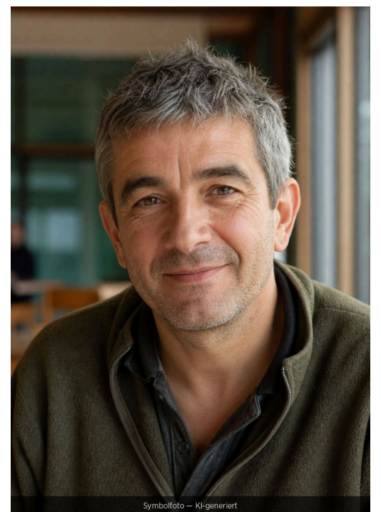
Symbolfoto – KI-generiert

hillendi nonsed mm quodiatet qui consedi t ex et reiiagnihil idigenimusae et, voluptur? Quia dolupta ipident. Ari abo. Nam unt aut ab uis andi doloritatet paritati dist, qui aligeni mendita eceribus, occullo incium utem expland. auusaectem qui nem et doluptata illa pratur moluptatia sande xceper. Magnatet, as erfero cum que